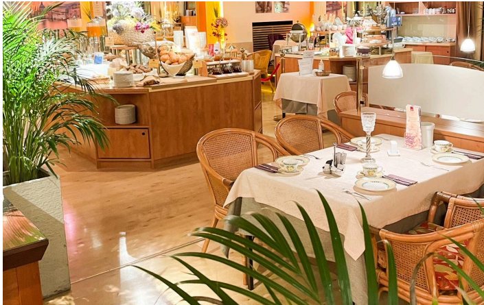
© City Hotel Ost am Kö Augsburg

Das City Hotel Ost am Kö in Augsburg befindet sich im Herzen der Stadt, direkt an der Fußgängerzone. Durch die zentrale Lage übernachten Sie nur wenige Gehminuten von Augsburgs historischer Altstadt entfernt. Die gepflegten 52 Zimmer des familiengeführten Traditionshotels verfügen alle über Flachbild-TV, Minibar, Schallschutzfenster und hochwertige Wohlfühlmatratzen mit exklusivem GORE-TEX Hygieneschutz, Satellitenradio und einen Haartrockner. Highspeed-Internet ist in allen Bereichen kostenlos verfügbar und die Rezeption ist 24 Stunden geöffnet. Der Tag beginnt mit einem hochwertigen Genießer-Frühstück. Zum Hotelangebot gehört außerdem eine kleine Sauna mit Ruhebereich.