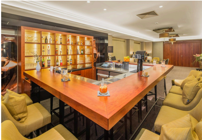
Best Western Plus Hotel Excelsior

ANMELDESCHLUSS Anmeldeschluss ist der 30.03.2026