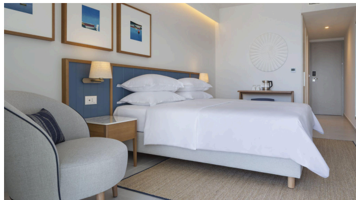
@ Bluesun Hotel Marina

Das komfortable 4-Sterne-Hotel Bluesun Marina befindet sich an der Strandpromenade von Brela, einem charmanten Ferienort an der Makarska Riviera. Die modern ausgestatteten Zimmer verteilen sich auf mehrere Etagen. Die stilvoll eingerichteten Zimmer sind klimatisiert und verfügen über einen Safe, eine Minibar, ein Sat-TV sowie kostenloses WLAN. Das Hotel, mit insgesamt 150 Zimmern, bietet ein Buffet-Restaurant sowie eine gemütliche Bar. Ebenfalls vorhanden sind ein Spa-Bereich mit Sauna und Whirlpool. Auf der Dachterrasse gibt es einen Pool, der einen Panoramablick auf das Meer bietet.